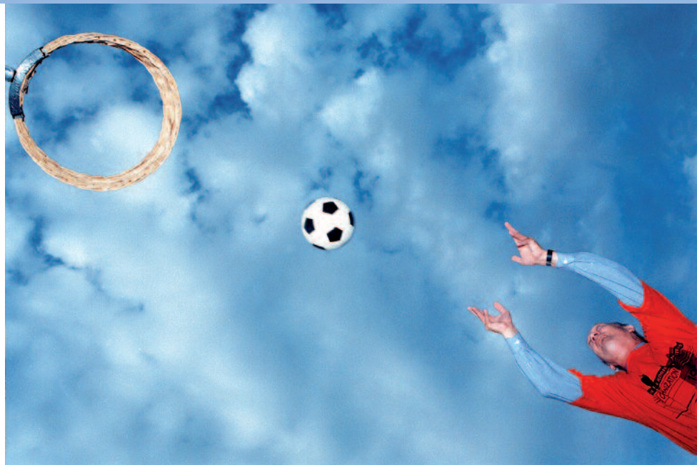
Opening eerste Haagse Korfbaldagen 1998.

De Haagse Korfbaldagen vindt zijn oorsprong in 1985 als zaalkorfbaltoernooi om de Binnenhofcup. Nadat het dagblad Het Binnenhof overgenomen werd door de Haagsche Courant werd het jaarlijkse breedtesporttoernooi voortgezet als Haagse Courant Cup (HC-cup).